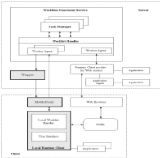
[그림 2] ICU/COWS와 새롭게 추가된 모듈

• Wrapper: 어플리케이션에 사용될 데이터는 Wrapper에 의해 변경된다. 어플리케이션에 사용될 데이터 혹은 작업 아이템에 필요한 데이터는 모바일 디바이스에 알맞도록 변형(추출) 되어야 하며, 이는 서버쪽에 존재하면서, 클라이언트와의 통신이 최소한의 사이즈로 이루어지도록 한다.